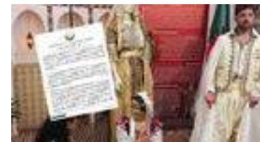
El-Haf). En réponse, le pavillon national continuera d'accueillir le public jusqu'au 22 mai pour valoriser l'histoire et les traditions du pays.

a exprimé sa vive indignation après l'agression ayant ciblé le pavillon algérien lors de la Semaine africaine à l'Unesco, le 20 mai 2026. Qualifiant cet acte d'irresponsable et contraire aux valeurs onusiennes, le ministère a affirmé son soutien aux poursuites judiciaires et administratives engagées par l'ambassade d'Algérie en France pour sanctionner les auteurs de ce dépassement. Pour le ministère, ces attaques désespérées trahissent une impuissance face aux succès d'Alger dans l'inscription de son patrimoine à l'Unesco, notamment la récente validation de la « Tenue traditionnelle du Grand Est algérien » (Caftan, Kat et