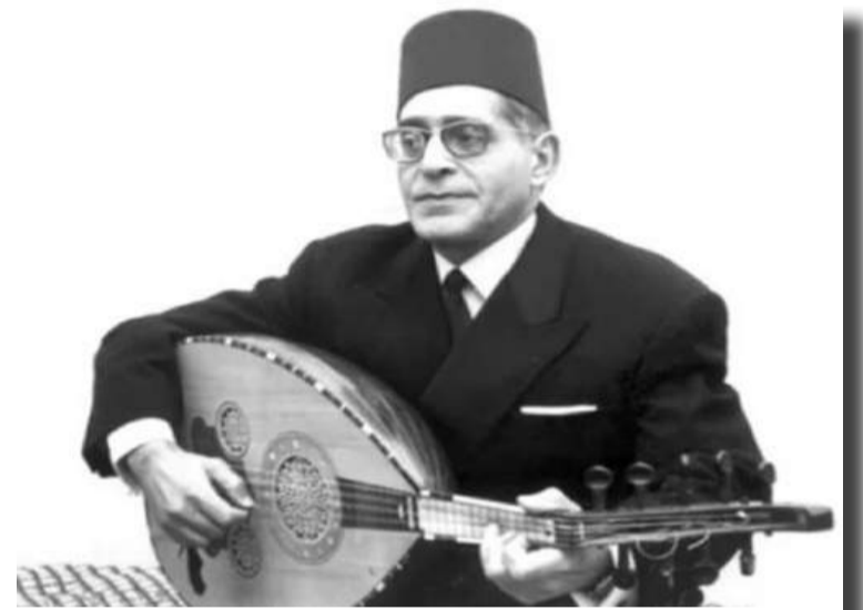
Figure incontournable du

patrimoine musical national, Abdelkrim Dali a largement contribué à l'essor et à la préservation du Madih en Algérie. Son répertoire spirituel comprend également des œuvres majeures telles que « Ya Imama Er-Rousli » et « Zada El Houbbou », qui témoignent de son attachement à la poésie mystique et au patrimoine religieux algérien.